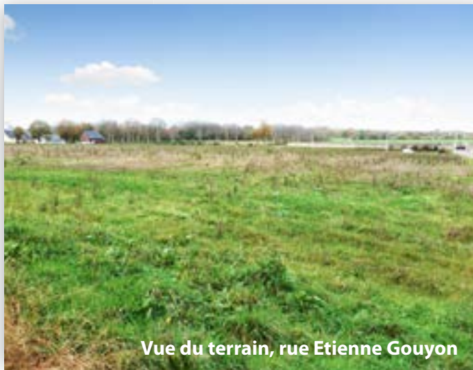
Vue du terrain, rue Etienne Gouyon