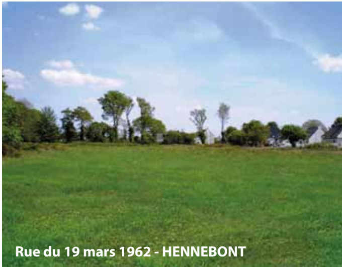
Rue du 19 mars 1962 - HENNEBONT

Achetez votre terrain à bâtir viabilisé, libre de constructeur sur lequel vous réaliserez la maison de vos rêves !