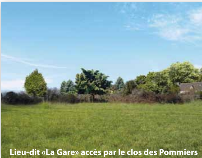
Lieu-dit «La Gare» accès par le clos des Pommiers