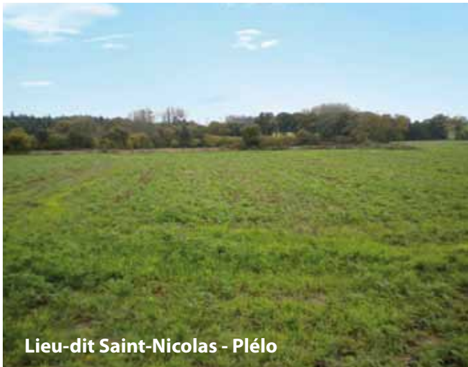
Lieu-dit Saint-Nicolas - Plélo